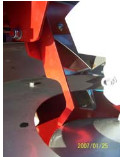
position af finger ved