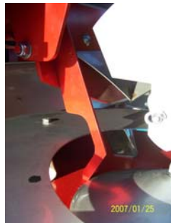
Finger in position