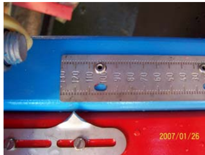
Scale value 120

The calibration finger has to touch the downshute plate and at the same time touch the spread disc and also touch the cone on top of the spread disc.