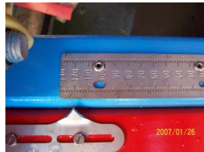
Калибровочный палец Палец, установленный в требуемое положение Шкала с установленной величиной 120

Калибровочный палец устанавливается в такое положение, при котором, он должен соприкоснуться с пластиной нижнего желоба и, одновременно, с разбрасывающим диском и конусом в верхней части разбрасывающего диска.