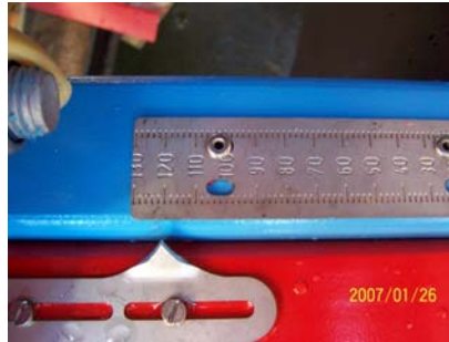
Bild 1 Kalibrierfinger