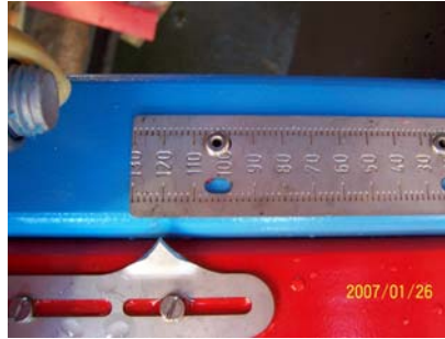
skala værdi 120

”Fingeren” skal følge nedløbspladen, som vist på det midterste billede ovenfor, samtidig skal den røre tallerknen, og kanten af ”kineserhatten” herpå.